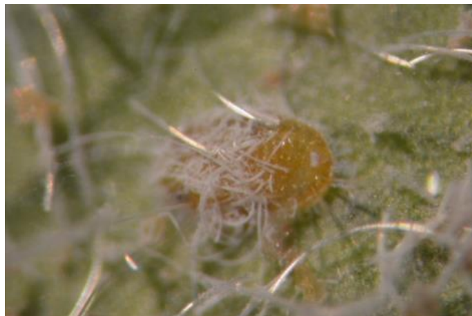
Figura 1. Pupa del cuarto instar de Paraleyrodes minei en Ficus benjamina colectada en el estado de Puebla.

Como todos los Aleurodicine, el dorso de la pupa posee poros grandes compuestos alineados a lo largo del submargen (Fig. 1). Además, la línula exertada del orificio baciforme. La variación en el tamaño y la morfología interna de los poros compuestos (Figs. 2 y 3), es notable en las especies de Paraleyrodes , y son útiles en la identificación provisional de especies cuando los machos adultos no están presentes.