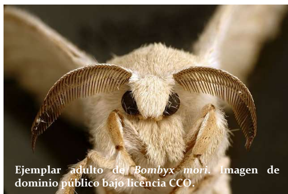
Ejemplar adulto de Bombyx mori . Imagen de dominio público bajo licencia CCO.

La reproducción sexual implica el encuentro de los sexos y el uso de las feromonas es un lugar común. Los insectos pueden usar feromonas sexuales para atraer a distancia a la pareja, para desencadenar cortejos sofisticados, para la aceptación del pretendiente o para repeler competidores.